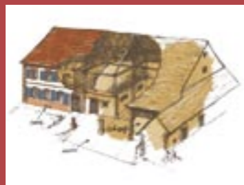
La Maison bloc

Il existe deux types dominants sur le territoire du Parc naturel régional des Vosges du Nord, la maison bloc et la maison cour.