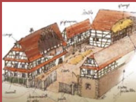
La Maison cour

Ces anciennes fermes représentent aujourd'hui un potentiel important en terme de volume à aménager. Un enjeu fort est de leur donner un nouvel usage en fonction de nos modes de vie actuels tout en prenant en compte les particularités de l'existant.