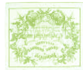
Souvenir de mariage

De la xylographie de la fin du 15 e siècle à la lithographie, du psautier enluminé à l'églomisé du 19 e siècle au Pays de Hanau, du souhait de baptême