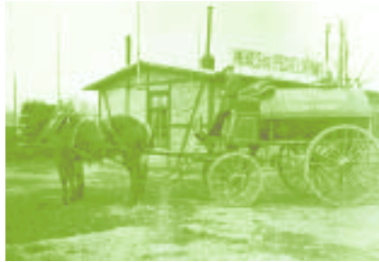
Attelage pour le transport de l'huile de Pechelbronn après la Première Guerre mondiale.

L'association des amis du musée du pétrole organise à Merkwiller-Pechelbronn du 25 juillet au 15 août 1999, le premier Festival du Pétrole et des Energies de la Terre.