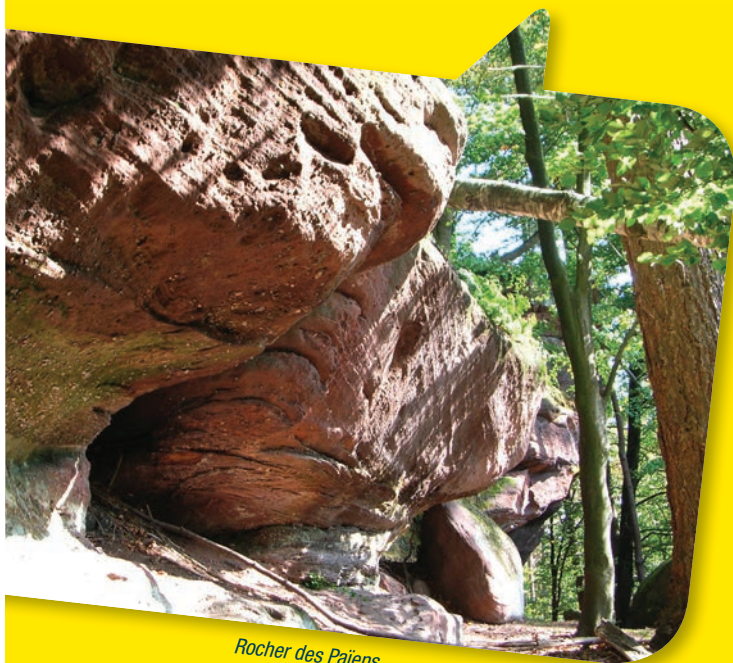
Rocher des Paiens

Descendre ensuite à droite du rocher, passer en-dessous, puis suivre □ jusqu'à La Petite Pierre. Remonter la rue Principale en direction de la vieille ville pour rejoindre le parking.