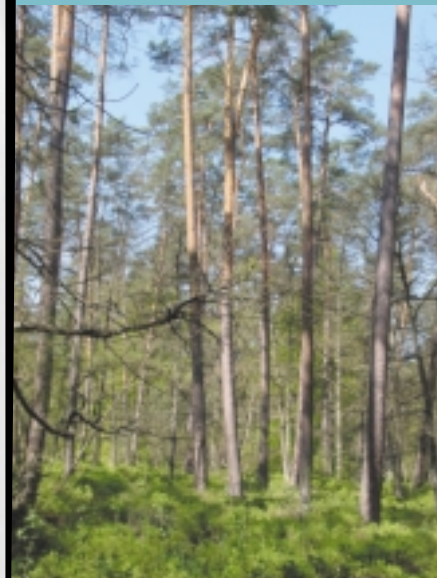
Pinède sur tourbe ▼