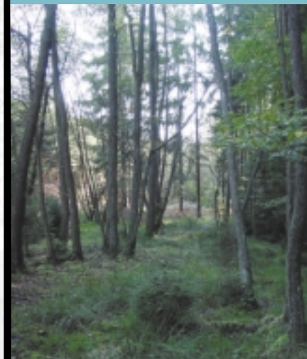
Aulnaie sur sphaignes ▲

Dans bien des cas, le drainage en forêt a eu pour conséquence d'accélérer la minéralisation de la tourbe superficielle. Ainsi, certaines pinèdes sur tourbe évoluent en chênaie acidifile.