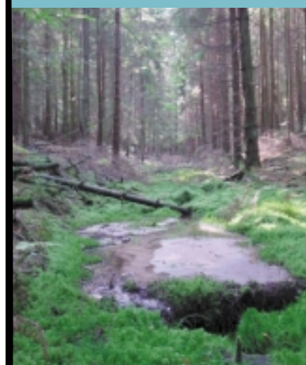
L'enrésinement de certaines parcelles empêche l'aulnaie de s'exprimer