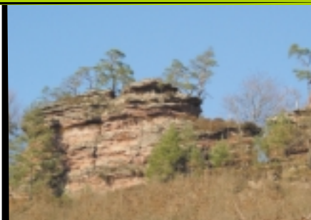
Une barre rocheuse où se reproduit le faucon pèlerin

De retour après plus d'un siècle d'absence, le grand corbeau qui bénéficie d'une protection nationale depuis 1981, a construit deux nids sur un rocher du Pays de Bitche en 2001. C'est le plus grand des passereaux, il se distingue de la très répandue corneille noire par sa taille (plus de 60 cm de longueur). De nature opportuniste, son régime alimentaire est très varié. La constitution d'une population dans les Vosges du Nord est probable dans les années à venir.