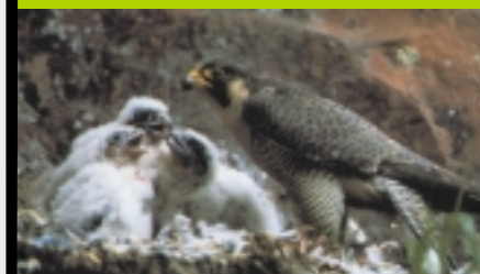
Les jeunes sont nourris au nid