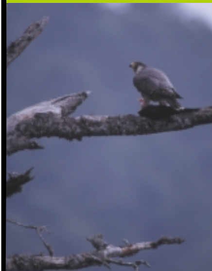
Redoutable prédateur, le faucon pèlerin s'attaque à des oiseaux de grande taille comme le pic noir