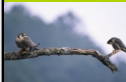
Parade amoureuse, à noter la différence de taille entre le mâle à droite et la femelle à gauche