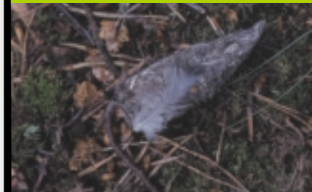
Cette pelote témoigne de son régime constitué exclusivement d'oiseaux

Dans les années 1980, après l'interdiction du DDT et la surveillance organisée par des associations de protection de la nature (SOS faucon pèlerin), l'espèce s'est de nouveau reproduite. Cependant, très sensible au dérangement, un nouveau danger la menace : les loisirs de pleine nature (randonnées, escalade, observation naturaliste, ...).