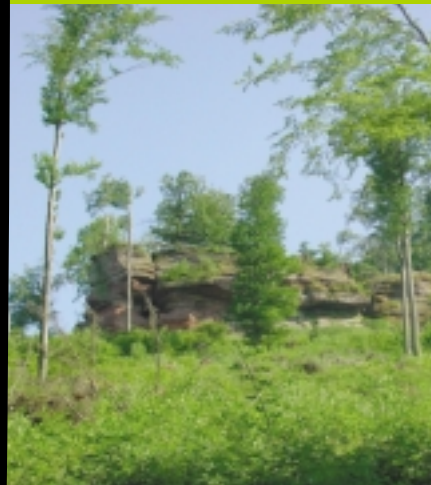
Un site de reproduction naturel du hibou grand duc