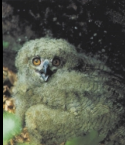
Un jeune à l'air

Entre la fin du XIX e siècle et les années 1980, le grand duc avait disparu des Vosges du Nord. Mais, depuis une quinzaine d'années, l'espèce est de retour grâce, notamment, aux importants lâchers pratiqués en Allemagne.