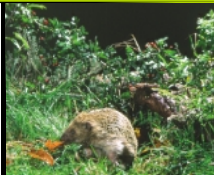
Le hérisson, une proie appréciée du hibou grand duc