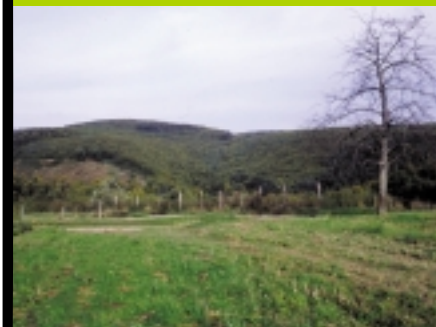
Le grand duc colonise les secteurs forestiers proches de grandes zones ouvertes